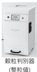
穀粒判別器 (整粒値)