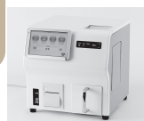
食味分析計 食味値