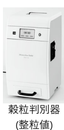
穀粒判別器 (整粒値)