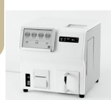
食味分析計 食味値